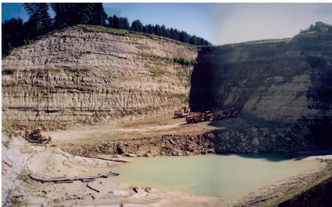
Vue générale de l'exploitation